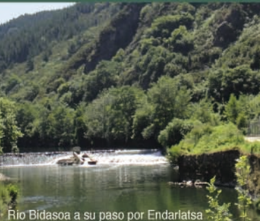
Río Bidasoa a su paso por Endarlatsa

Endarlatsa es un punto de referencia para la pesca. El salmón y la trucha son los protagonistas.