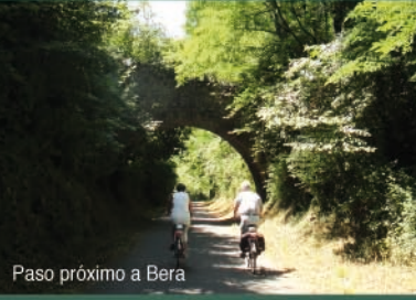
Paso próximo a Bera

Endarlatsa es un punto de referencia para la pesca. El salmón y la trucha son los protagonistas.