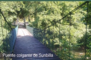
Puente colgante de Sunbilla

Hay que respetar el paso de animales y automóviles de los vecinos que viven en los caseríos por donde pasa la Vía Verde.